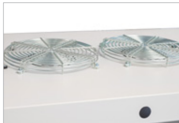
Thermostatgesteuerter Doppellüfter mit Abdeckgitter auf der Schrankoberseite