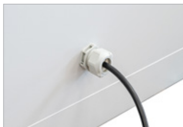
Zuleitung auf der Rückseite (3 Meter)