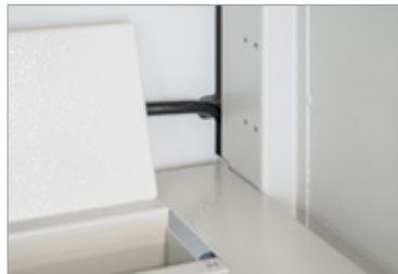
Saubere Kabelführung dank Kabelabdeckung in der Ecke, die alle sichtbaren Kabel verdeckt